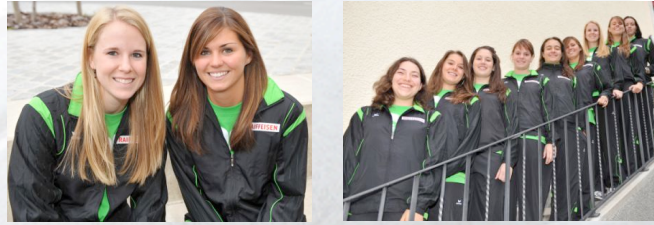
Meilleures joueuses de VFM et Lucerne désignées en fin de match par les entraîneurs adverses avec le parrainage de: Fleurs A L'EGLANTINE au Noirmont

CH-2350 Saignelégier Tel 0041 32 951 16 88 www.cafe-du-soleil.ch