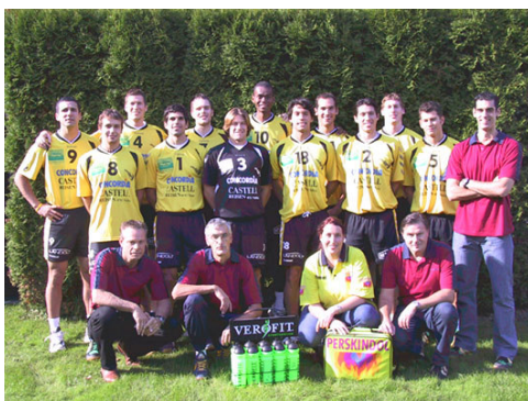
Concordia MTV Näfels